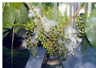
شکل ۱- شاخه حامل کپسول صنوبر Figure 1. A twig containing capsules

۲- کاشت بذور تهیه شده از پایه مادری صنوبر ( Populus deltoids 69/55)