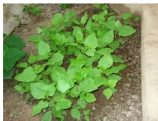
شکل ۳- نهال‌های بذری صنوبر در بستر کاشت گلخانه Figure 3. Poplar seed-origin seedlings in the greenhouse

الف- رشد قطری نهالها مقادیر به‌دست‌آمده از میانگین رشد قطری نهال‌های هیبرید P.x.87.1.S با مقدار ۲/۱۳ سانتی‌متر در گروه نخست گروه‌بندی آزمون دانکن قرار گرفته است و پایه شاهد ( P.d.69/55 ) به همراه سه هیبرید دیگر با نام‌های P.x.89.3.C, P.x.88.4.C, P.x.88.5.C در بین گروه اول و دوم قرار گرفته‌اند که با هریک از آنها اختلاف معنی‌داری دارند.