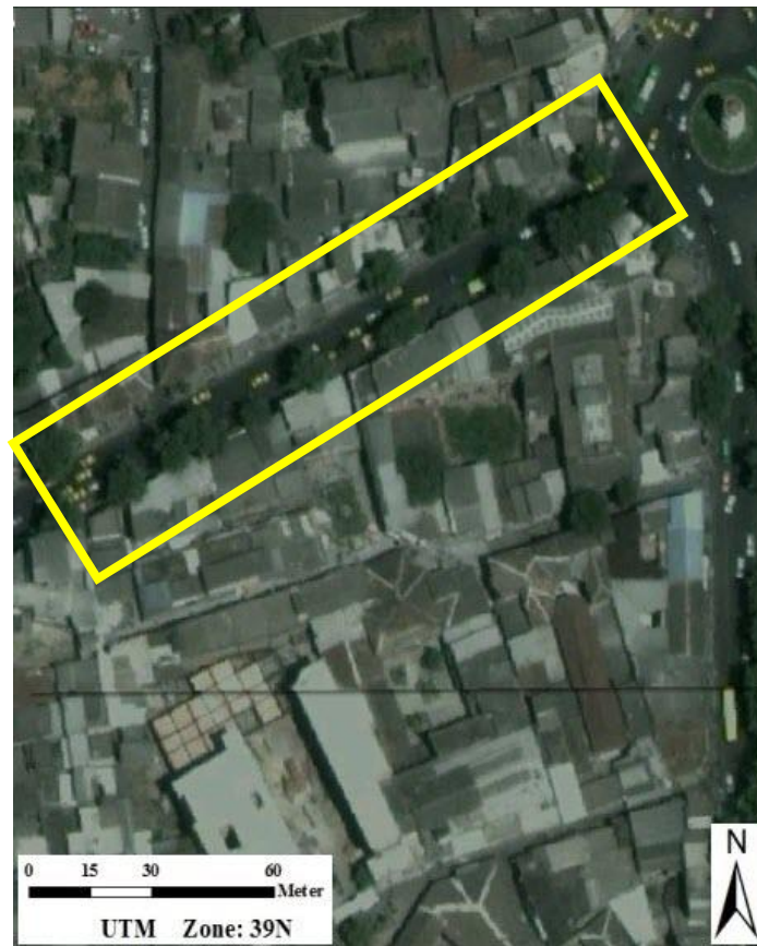
شکل ۱- تصویر ماهواره‌ای Ikonos در پایگاه اطلاعاتی Google Earth از منطقه مورد پژوهش

اتمسفیری از کاهش تیرگی (Dark Subtract) استفاده و نسبت به زون منطقه (UTM, zone: 39N) زمین مرجع شدند (شکل ۱).