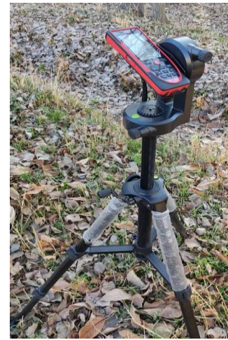
شکل ۲- نحوه استقرار دستگاه لایکا در توده صنوبرکاری