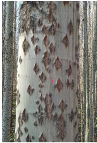
شکل ۳- برخورد نور لیزر دستگاه لایکا به تنه صنوبر برای اندازه‌گیری قطر